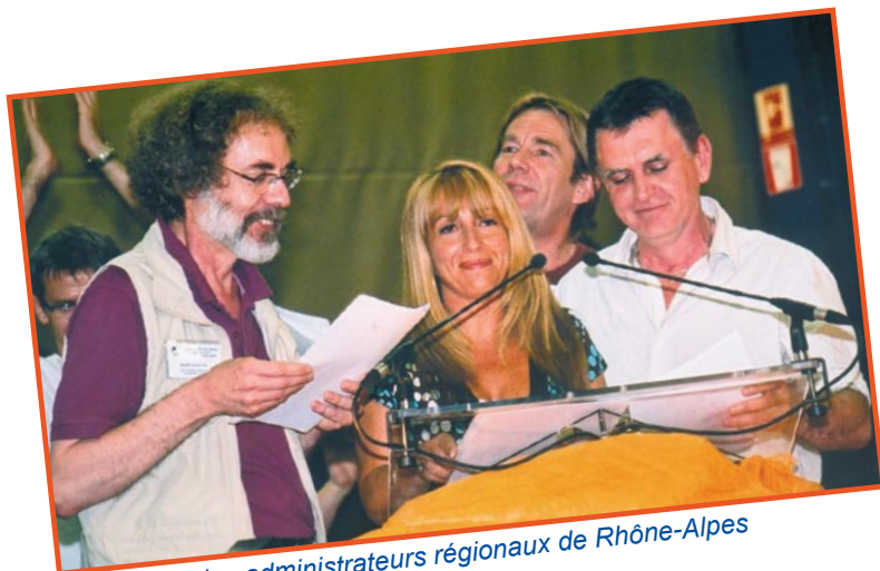
Le quatuor des administrateurs régionaux de Rhône-Alpes