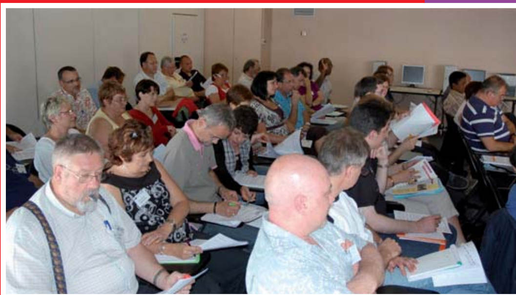
Deux commissions au travail