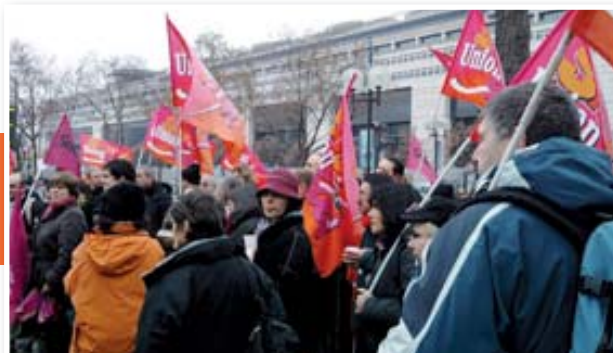
Dans le même temps, plusieurs centaines de militants de l'Union SNUI-SUD Trésor Solidaires de Paris et de province, étaient venus soutenir l'initiative du syndicat en manifestant devant Bercy.